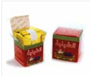
Bag in box ou boîtes