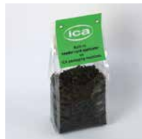
Cartonnette de tête