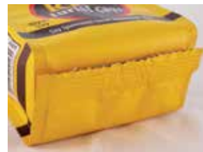
Fond parfaitement plat