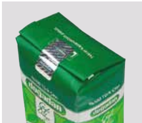
Etiquette de tête