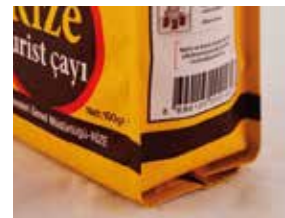
4 arêtes scellés