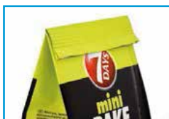
Tête droite, repliée