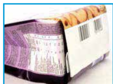
Fond parfaitement équilibré