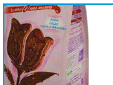
4 arêtes scellées

Nos ensacheuses ICA permettent de travailler - des matériaux plus fins, puisque le scellage des arêtes rigidifie les faces avant et arrière des paquets. Ainsi Le rabat du fond est toujours parfaitement replié et «repassé», avec des matériaux bi-soudants, bloqué au fond du paquet grâce à un mouvement spécial des mâchoires de scellage.