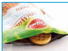
Zip sur sachet Stand-up