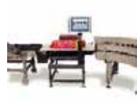
Contrôle de poids