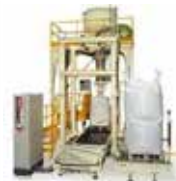
A poids net