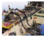
Marquage + pose étiquettes