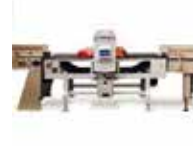
Détecteur de métaux