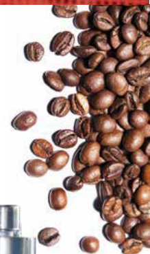
Torréfacteur automatique type KS5 dans ce cas monté sur châssis

A votre disposition pour étudier vos projets