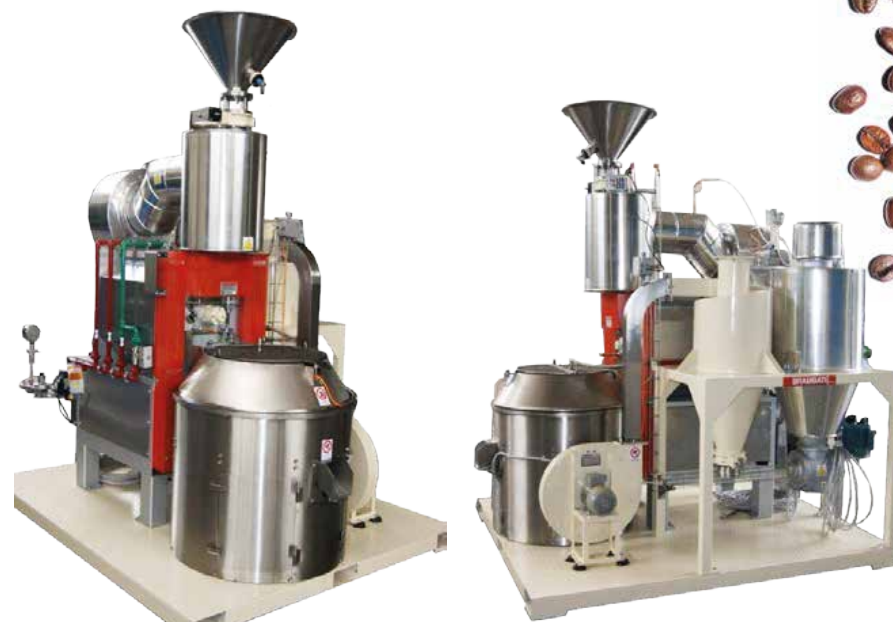
Torréfacteur automatique type KS5 dans ce cas monté sur châssis

A votre disposition pour étudier vos projets